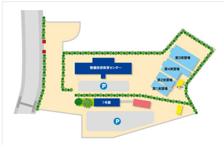
図 2-5-2 向野キャンパス（上段）及び中尾山キャンパス（下段）配置図