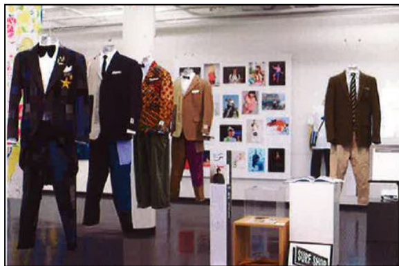
令和元（2019）年度 ファッションデザイン学科：「発想のカタチ」拡がるーファッションの領域に向けてー