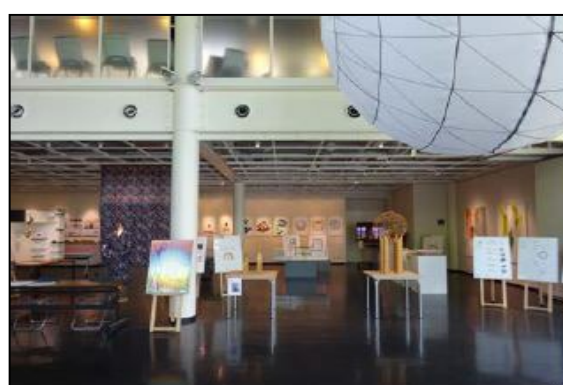
平成 28（2016）年度 大学院：神戸芸術工科大学 大学院展