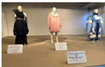
ファッションデザインコンテスト選抜展（第2展示室）