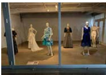
教員作品展（第2展示室）