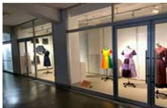
「基礎造形応用」作品展（第1展示室・立体）

展示の企画やスケジュールなどの運営はキャンパス展示企画委員会が年間を通して行っている。