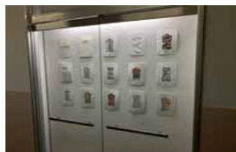
「色材演習」作品選抜展（第1展示室・平面）