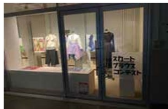
「スカートブラウスコンテスト」展（第1展示室・立体）