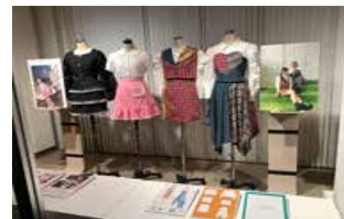
「スカートブラウスコンテスト」展（第1展示室・立体）