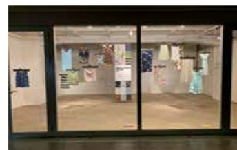
「テキスタイルデザインコース」作品選抜展（第2展示室）