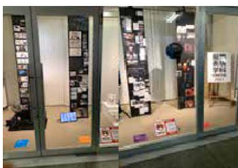
服飾表現学科・卒業制作作品展（第1展示室・立体）