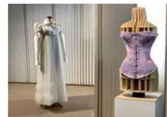
教員作品展（第1展示室・立体）