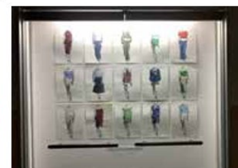
「ドローイングI」作品選抜展（第1展示室・平面）