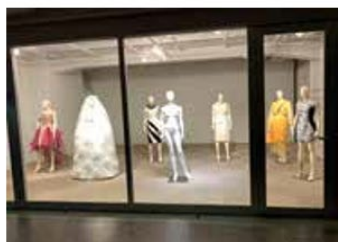
教員作品展（第2展示室）