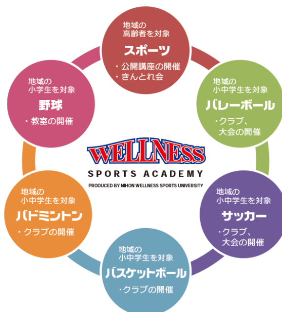
図 A-1-1 地域におけるスポーツ・健康活動「ウェルネススポーツアカデミー」事業展開の体系図

「利根町と日本ウェルネススポーツ大学との連携に関する協定書」に基づき、開学以来立ち上げ実施してきたジュニアクラブ、サークル教室等を、平成 29（2017）年 4 月に体系化し「ウェルネススポーツアカデミー」とした。このアカデミーは、学生の学びの場が大学内に留まらず、地域のイベントに参加することにより、実際の間を通して企画、立案、運営等のスポーツプロモーションを学ぶと共に、子供から高齢者に対する処遇や指導法を身に着ける重要な場とし、また併せて地域の社会貢献を目指すものとした。